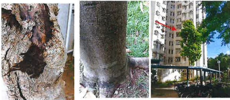
白蘭樹生蟲、枯萎及斷枝